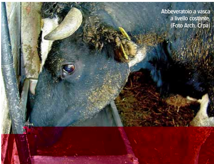
Abbeveratoio a vasca a livello costante.

L'acqua destinata all'abbeverata deve comunque essere di buona qualità, perché in caso contrario acque non idonee possono comportare problemi sanitari, riduzione delle prestazioni produttive, alterazione della qualità dei prodotti e danni alle attrezzature. In