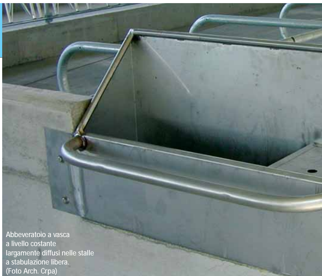
Abbeveratoio a vasca a livello costante largamente diffusi nelle stalle a stabulazione libera.

(1) produzione di 13,5 kg/giorno di latte; (2) produzione di 23 kg/giorno di latte; (3) produzione di 36 kg/giorno di latte; (4) produzione di 45 kg/giorno di latte; (5) consumo a temperatura ambientale compresa fra 10 e 27°C.