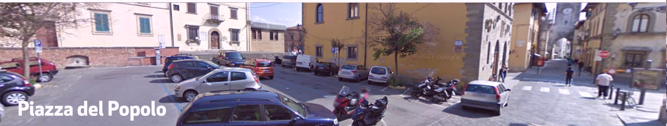
Piazza del Popolo